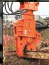
Cizallas de demolición