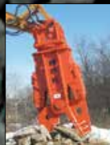
Procesadores de material