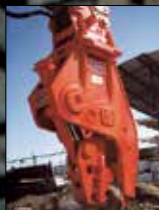
Trituradoras de concreto