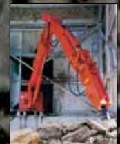
Sistemas Fijos en Pedestal