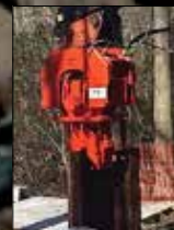
Empujadores de tablestacas