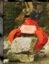
Agarres de demolición